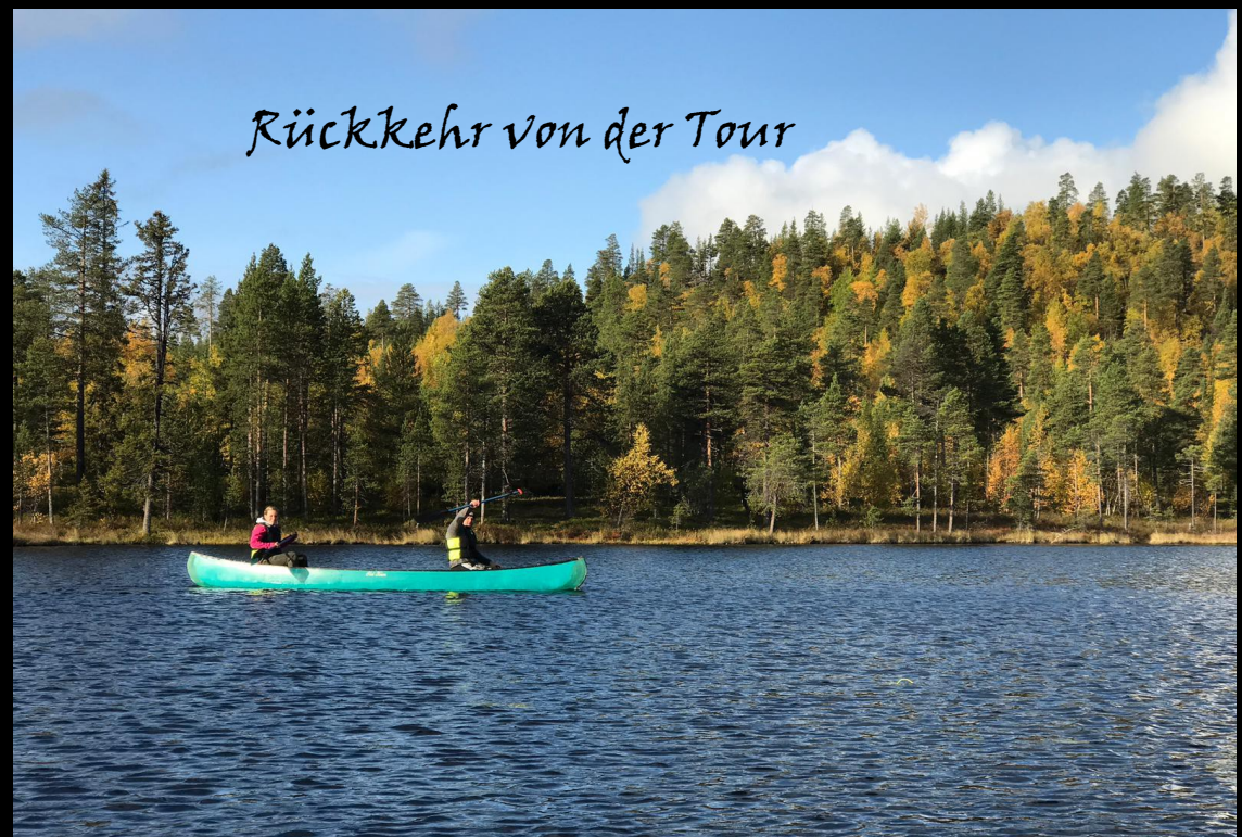
Rückkehr von der Tour