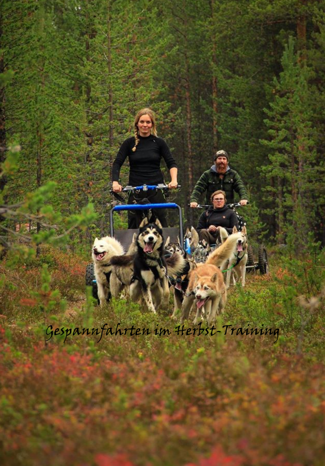
Gespannfahrten im Herbst-Training